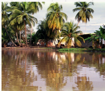
CORRESPONDANCE COTE D'IVOIRE Dépollution de la Lagune (francophone)