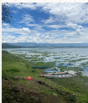
CORRESPONDANCE KENYA Préservation des écosystèmes aquatiques (anglophone)