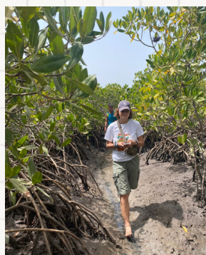
CORRESPONDANCE SENEGAL Protection de la mangrove et accès à l'eau (francophone)